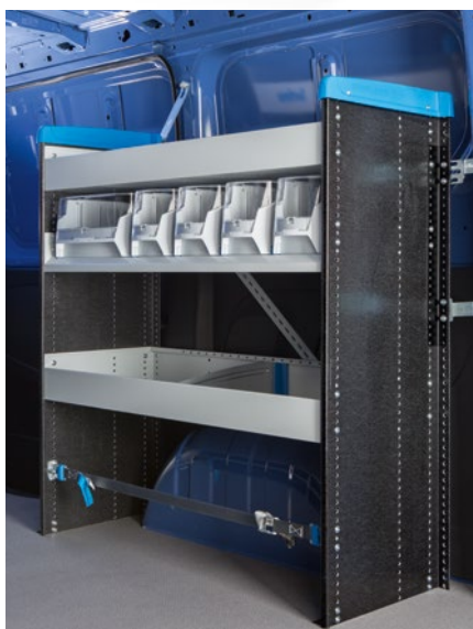
Aménagement côté droit de la zone de chargement.