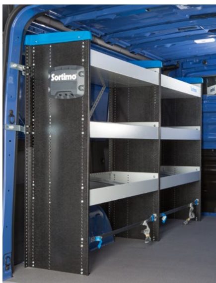
Aménagement côté gauche de la zone de chargement.