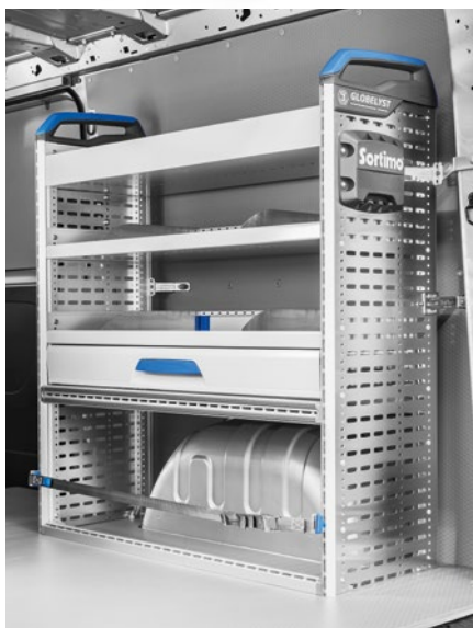
Aménagement côté droit de la zone de chargement.