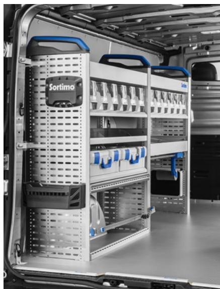
Aménagement côté gauche de la zone de chargement.