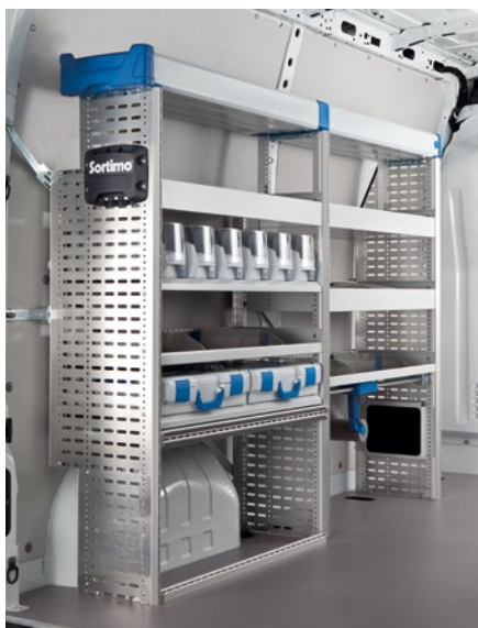
Aménagement côté gauche de la zone de chargement.