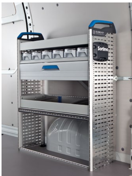
Aménagement côté droit de la zone de chargement.